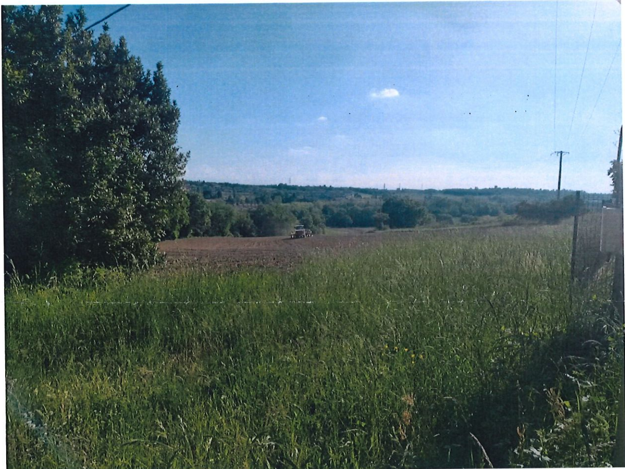
Parcelle A 195 BEAUPUY